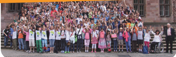
Auszeichnungsfeier der "Fairen Schulklassen" - Rathaus Saarbrücken